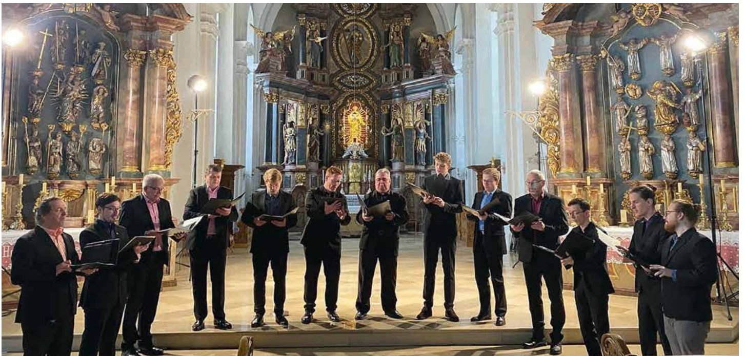
44 Jahre Musikakademie HAB mit dem MSB-Männer-Ensemble

69. Jahrgang | www.maintal-saengerbund.de