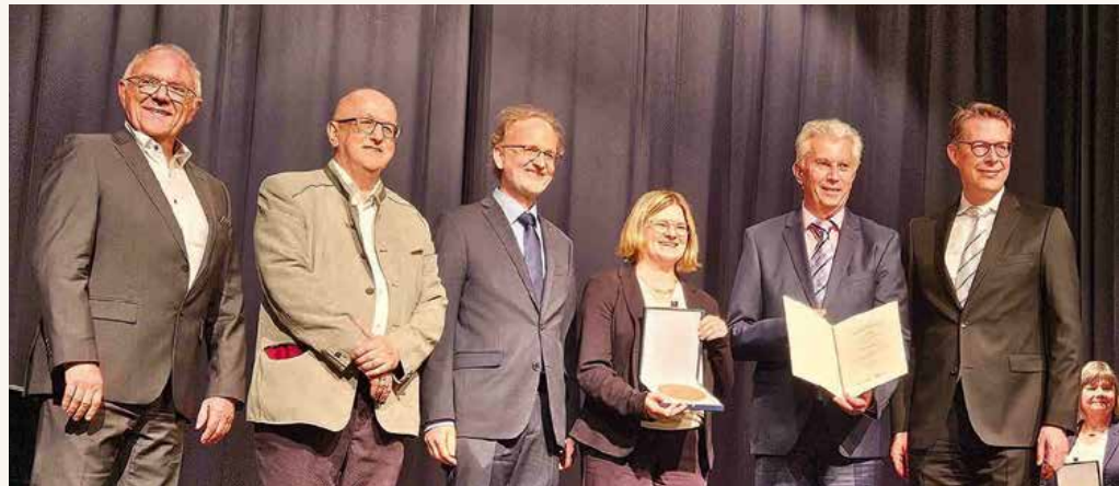
Kirchenchor Maria Geburt aus Aschaffenburg-Schweinheim