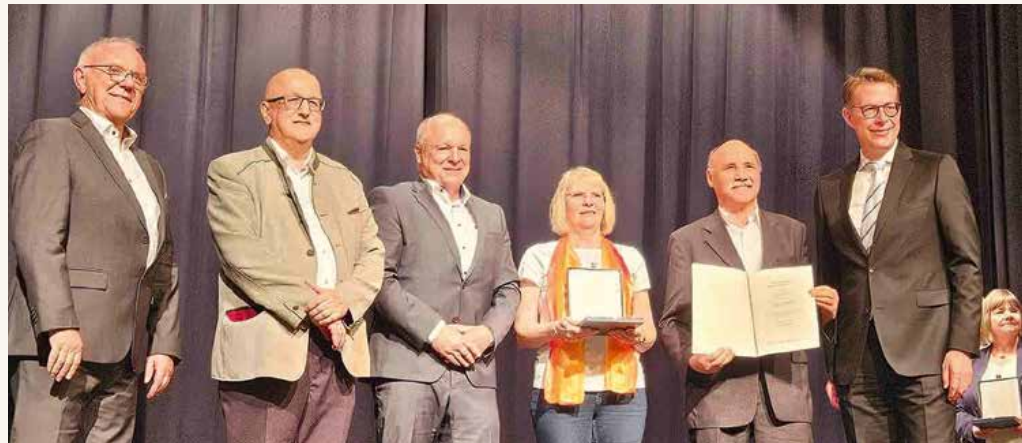
Gesangverein Sängerkunst Hausen 1924 e.V.