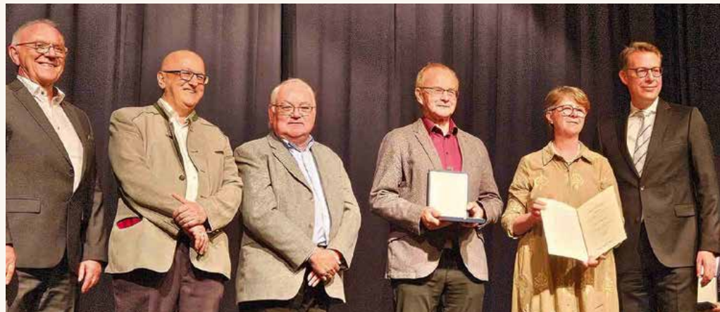
Happy-Hour Liederquell Umpfenbach

ten würdigt dieses langjährige Engagement in herausragender Weise. Auch ich gratuliere den geehrten Chören und Orchestern ganz herzlich.“